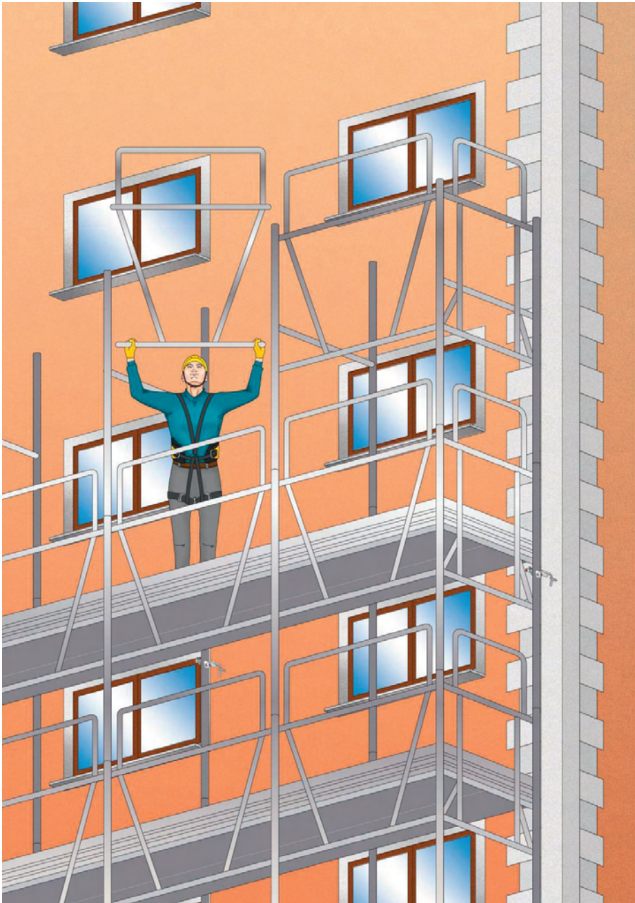
Figura 6 - Montaggio di un ponteggio con telaio parapetto (montaggio dal basso)