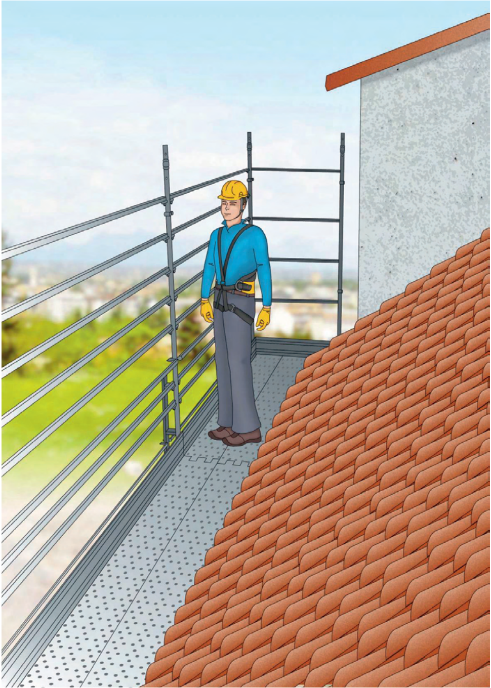
Figura 4 - Esempio di ponteggio utilizzato per la protezione dei bordi