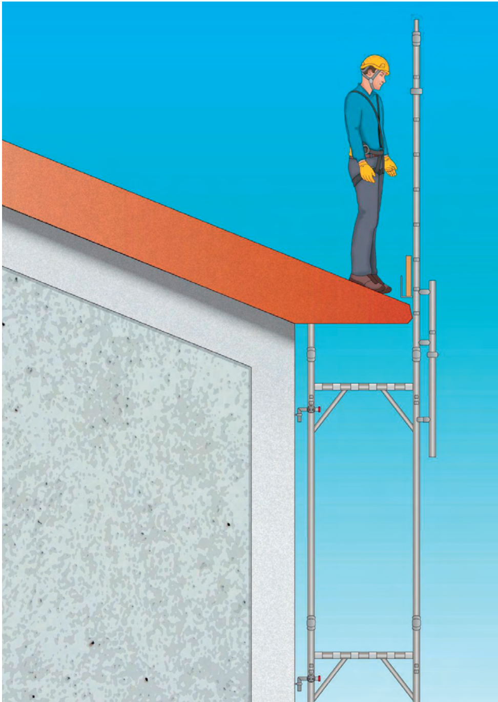
Figura 5 - Esempio di ponteggio utilizzato per la protezione dei bordi