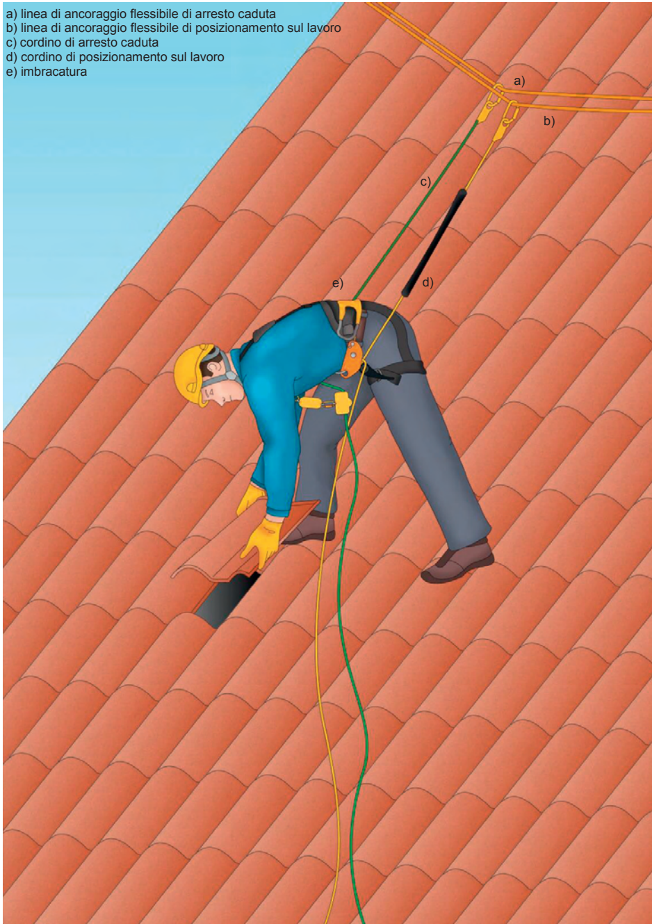
Figura 3 - Esempio di un sistema di posizionamento sul lavoro che include un sistema di arresto caduta