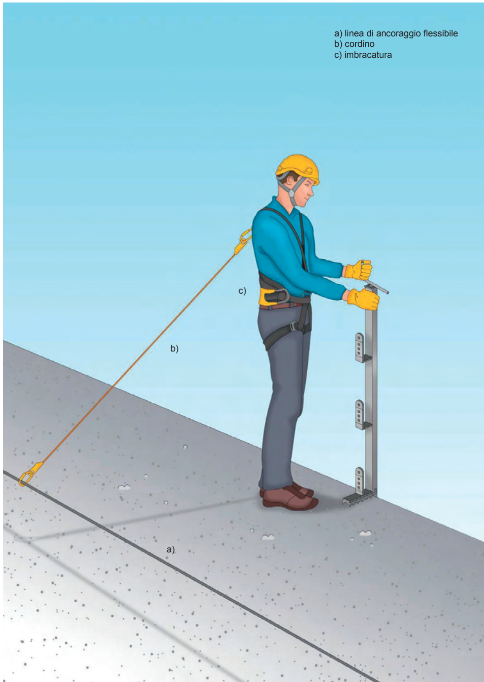
Figura 1 - Esempio di un sistema di trattenuta