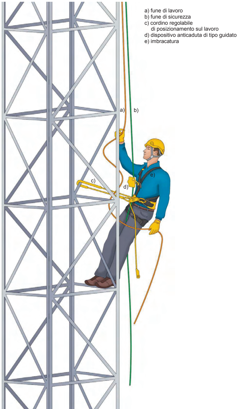
Figura 2 - Esempio di un sistema di posizionamento sul lavoro