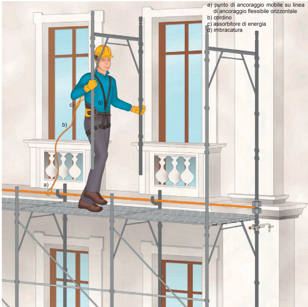
Figura 5 - Esempio di un sistema di arresto caduta su linea di ancoraggio flessibile orizzontale che include un cordino e un assorbitore di energia